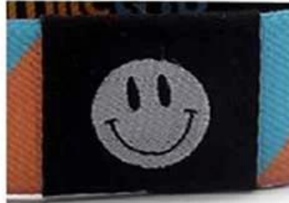
Panton woven logo