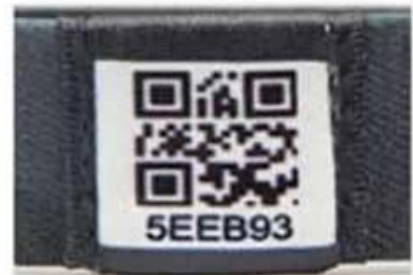
Unique QR code and number