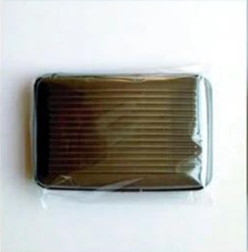
Normal opp bag