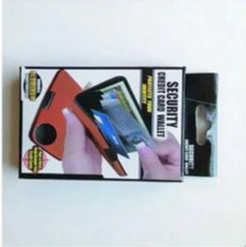
Custom printed box