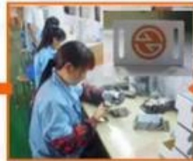
6. Testing & QC