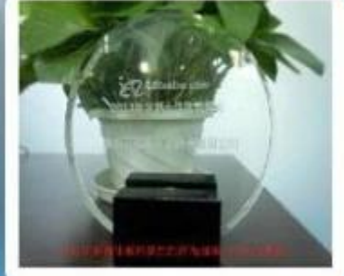
Outstanding and Honorable E- Businessman Award by Alibaba in 2011

في مجموعة متنوعة من RFID البطاقات الذكية المحدودة تقدم أساور المعصم Chuangxinjia شركة شنتشن المواد، مثل السيليكون والقماش المنسوج والبلاستيك والورق وما إلى ذلك. يمكننا تخصيصها لتشمل شعارك ولدينا لنقاط البيع، وغرف الفنادق بدون مفتاح، والتحكم في RFID مجموعة متنوعة من عروض الألوان. لدينا أساور المعصم الوصول والأمن، ومنع التزيف، وبرامج ولاء العملاء، والبيئات المقاومة للماء. هدفنا هو المساعدة في تصميم سوار معصم محكم الإغلاق يمكنه تخزين البيانات ونقلها بشكل موثوق.