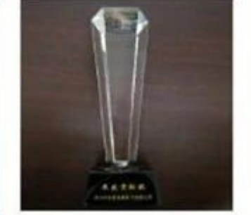
Outstanding and Honorable EBusinessman Award by Alibaba in 2010