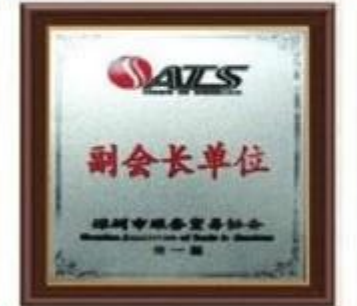
Vice President Company of Shenzhen Association of Trading in Services