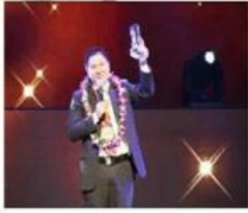
Top 10 Global Netentrepreneurs Award