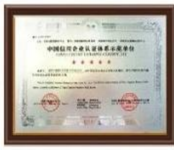
China Credit Example Certificate