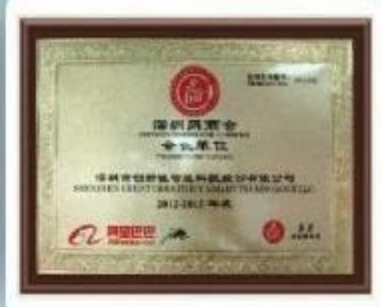
President Member Company of Shenzhen Chamber of E-Commerce