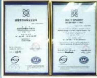
ISO9001:2000 Quality Management System