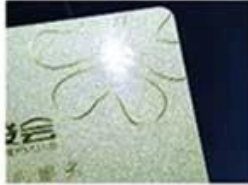
golden Hot Stamping