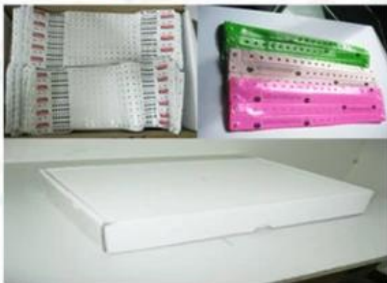
Package for Soft PVC/ Paper Wristbands