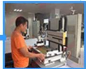
5.Film fabrication for printing