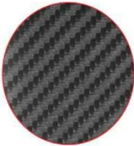
CARBON FIBER TEXTURE