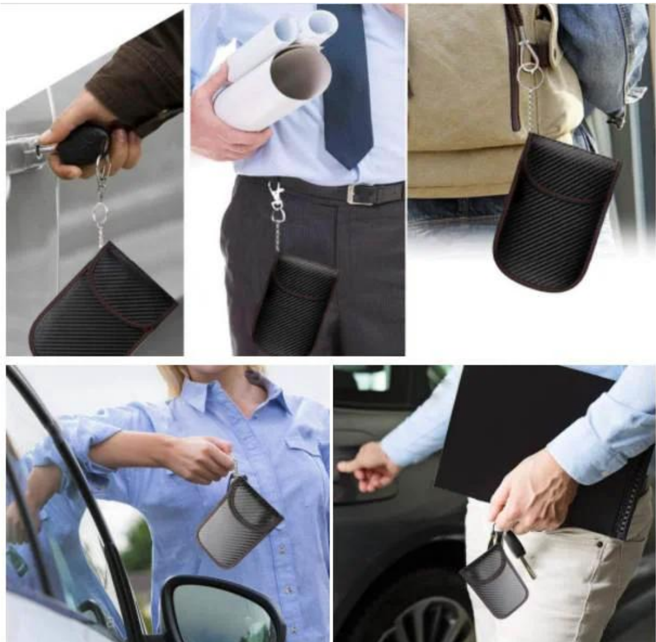
صورة مفصلة RFID حقيبة حجب إشارة: