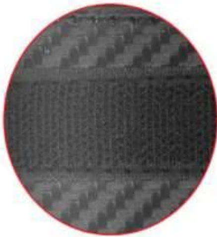
HIGH QUALITY VELCRO