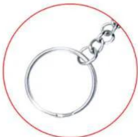
FIRMLY METAL KEYCHAIN