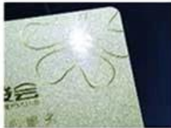
golden Hot Stamping