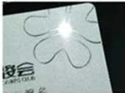
Silver Hot Stamping