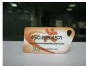
7. NFC PVC Tags