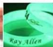
glow in dark