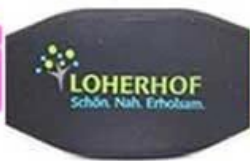
3 C silk screen printing