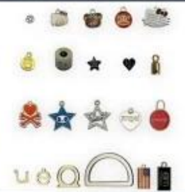
Logo plate Enameled tag Antique medal Decor Jewelry tag