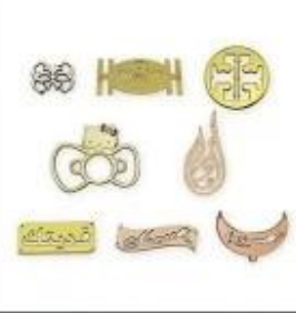
Money clip Bag label Silver plate Gold tag Cutting through