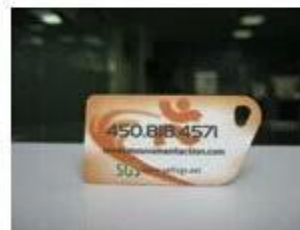
7. NFC PVC Tags