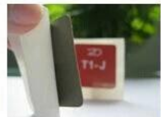
8. Anti-metal Stickers

Pulseiras de tecido são feitas de tecido e podem ser produzidas em cores. Eles vêm com um