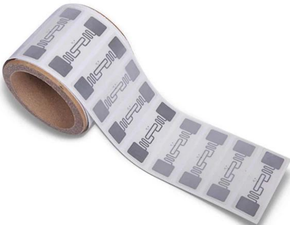
Foto do produto de 860-960mhz embutimento molhado da rfid UHF

Adesivas etiquetas RFID são amplamente utilizadas no fornecimento de gestão de bens, das parcelas e dos serviços postais, logística e sistema de gestão da armazenagem, serviços de aluguel e biblioteca, etiquetas de bagagem aérea, certificação de produto, segurança marca, o sistema de identificação habituais, rótulo de vaso de pressão e os adesivos de logística de outros adesivos de logística de bens não-metálicos.