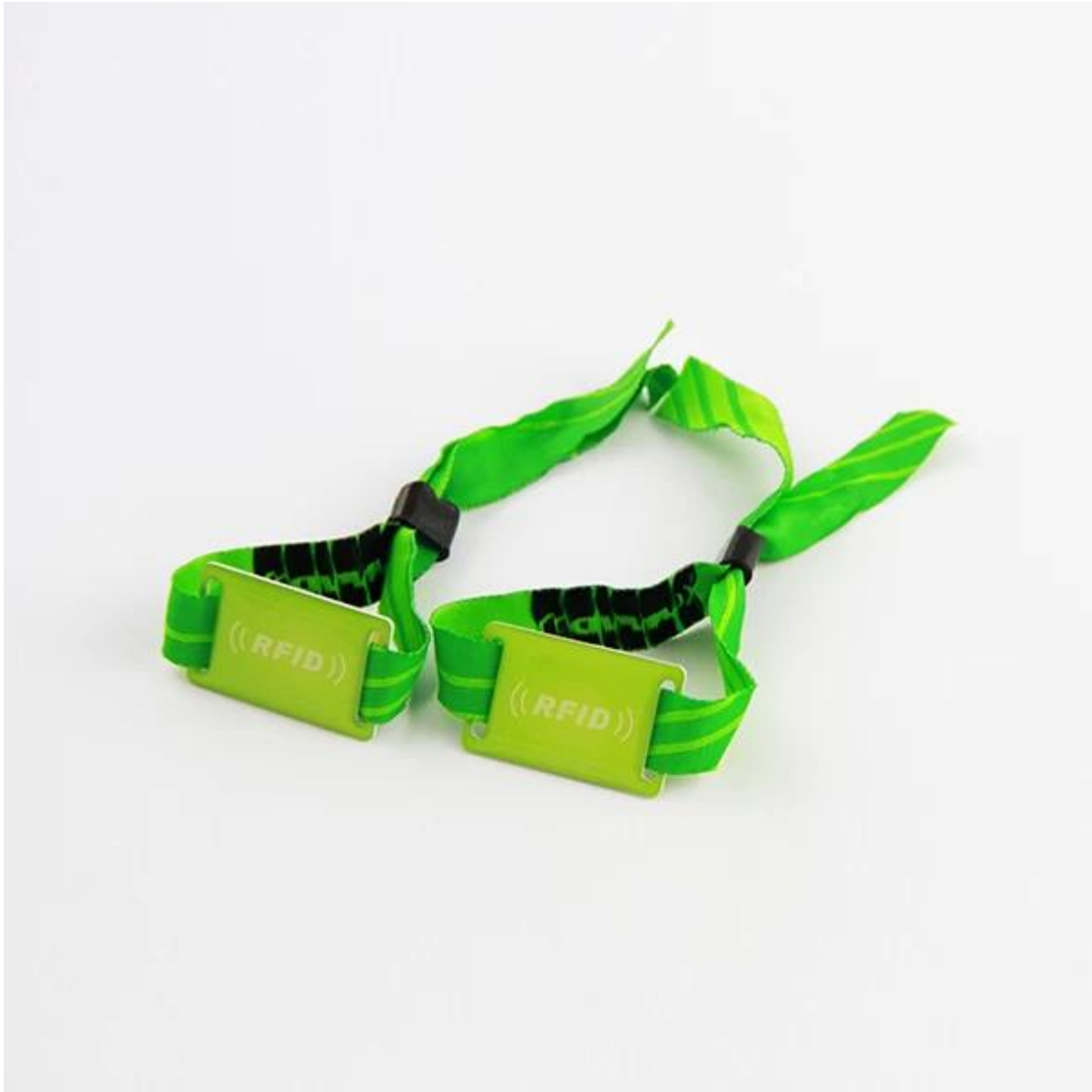
Hoofdtoepassingen voor geweven RFID-polsbanden