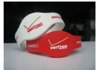
4. Silicone Wristbands (Full Sealed Type)