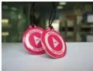
2. NFC Epoxy Tags