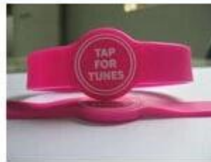
3. Silicone Wristbands (Adjustable Type)