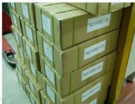
Outside Carton Package