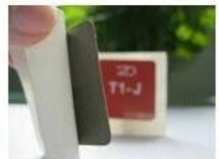
8. Anti-metal Stickers

□□ □□ □□□□ □ □ □□□□ □□ □ □ □□□□. □□□□ □□ □□ □ □ □□ □□ □□□□ □□ □ □ □□□□ □□□□ □□□□