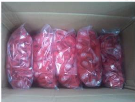
Package for Silicone Wristbands