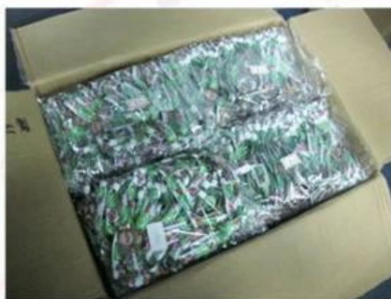
Package for Woven Wristbands