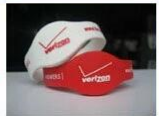
4.Silicone Wristbands (Full Sealed Type)