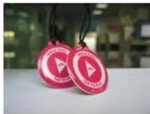
2.NFC Epoxy Tags