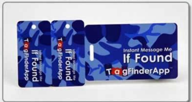
4. Comb card-style four