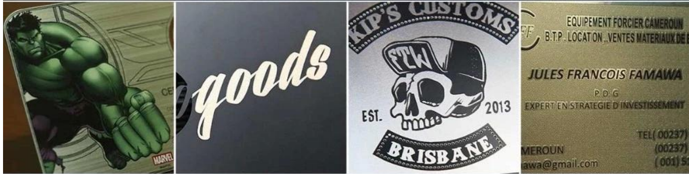
Offset printing Laser Screen printing Embossed