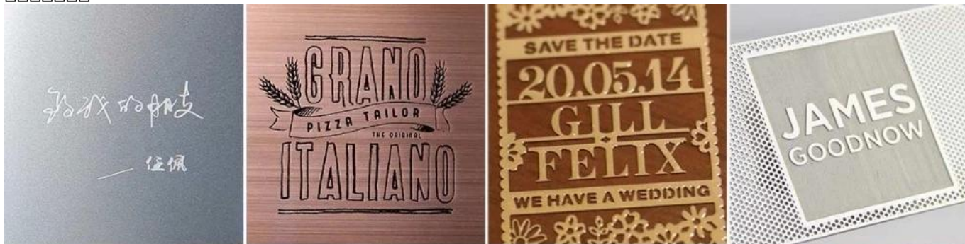
Etch only Etch with color infilling Cut through Etch reverse