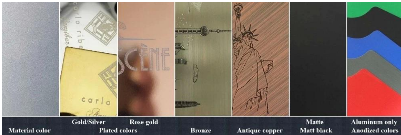
Material color Gold/Silver Plated colors Rose gold Bronze Antique copper Matte Matt black Aluminum only Anodized colors