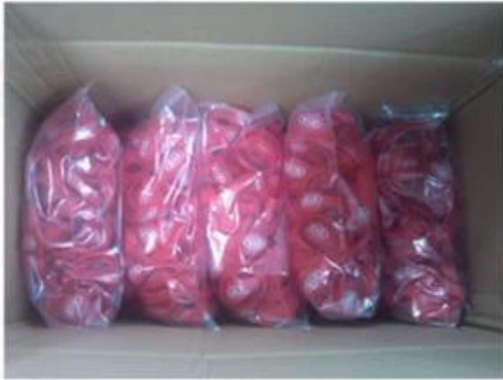
Package for Silicone Wristbands