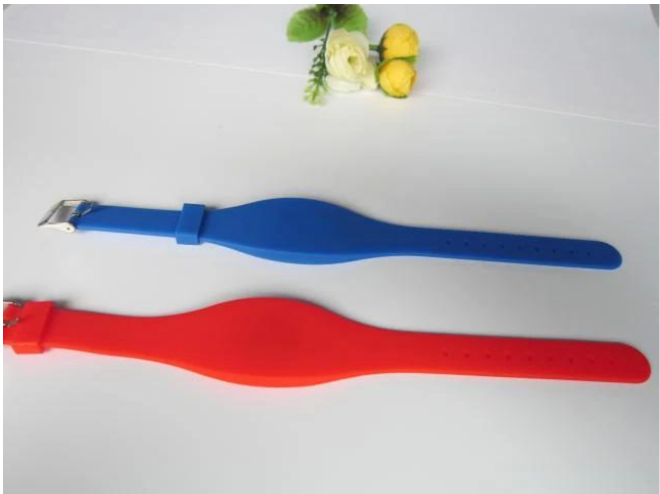
Altri prodotti della nostra azienda