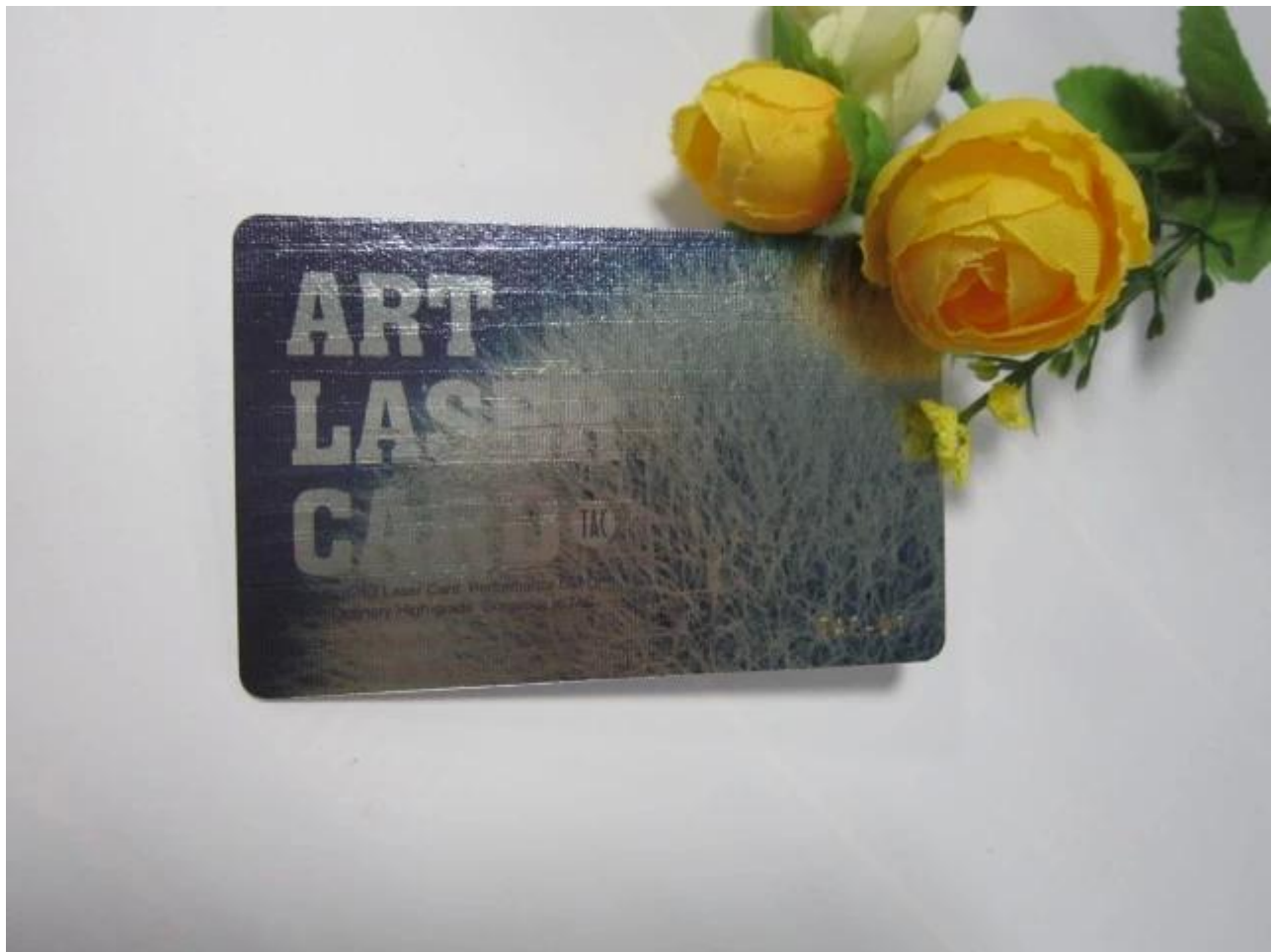
Confezione logo carta stampa RFID con il prezzo a buon mercato