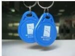
6. NFC Keyfobs