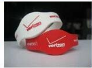
4. Silicone Wristbands (Full Sealed Type)