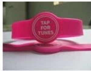
3. Silicone Wristbands (Adjustable Type)