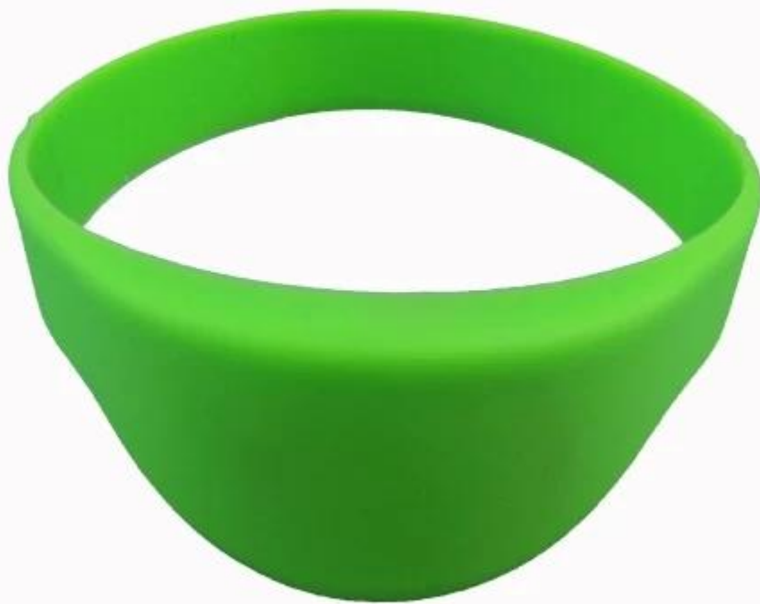
Immagine del prodotto di chiudere braccialetto RFID di semicerchio silicio

Smart card Co., srl di Shenzhen Chuangxinjia offre braccialetti RFID in una varietà di materiali, come il silicone, tessuti (panno) e plastica, carta ecc. Noi possiamo personalizzarli per includere il tuo logo e abbiamo una varia gamma di offerte di colore. Abbiamo braccialetti RFID per punto vendita, camere keyless, controllo accessi & sicurezza, contraffazione prevenzione, programmi di fidelizzazione del cliente e ambienti impermeabili.