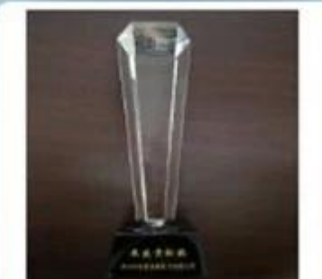
Outstanding and Honorable EBusinessman Award by Alibaba in 2010