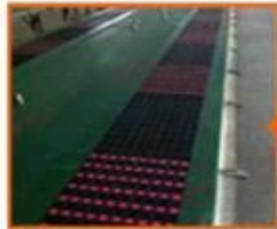
8. Strip printing