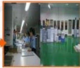
4. Matching & Compounding