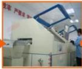
2. Chip bonding