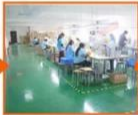
10. Final QC