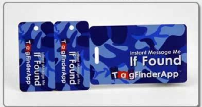
4. Comb card-style four