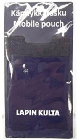
OPP bag+small card