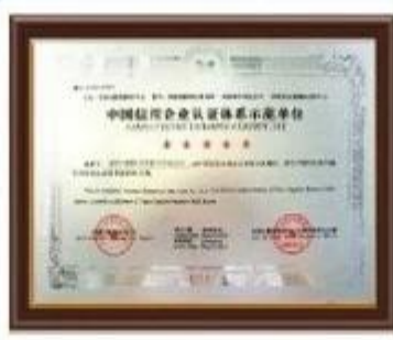
China Credit Example Certificate