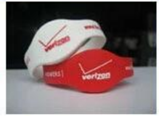
4.Silicone Wristbands (Full Sealed Type)