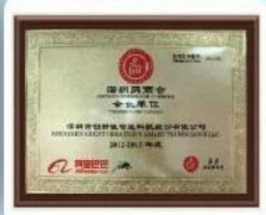
President Member Company of Shenzhen Chamber of E-Commerce