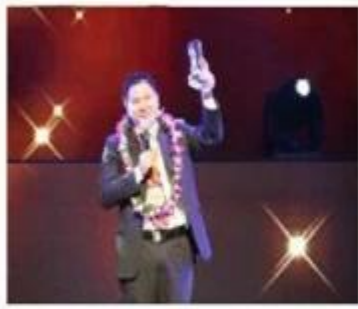
Top 10 Global Netentrepreneurs Award