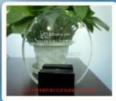
Outstanding and Honorable E- Businessman Award by Alibaba in 2011