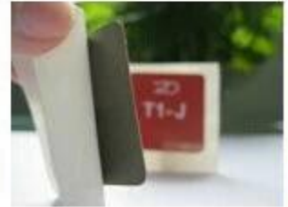
8. Anti-metal Stickers