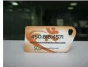
7. NFC PVC Tags