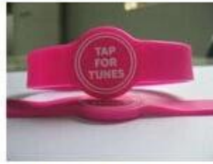
3.Silicone Wristbands (Adjustable Type)