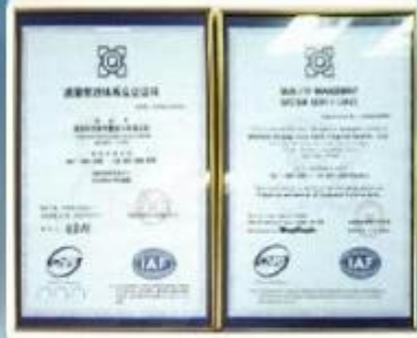
ISO9001:2000 Quality Management System