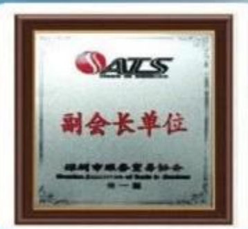
Vice President Company of Shenzhen Association of Trading in Services