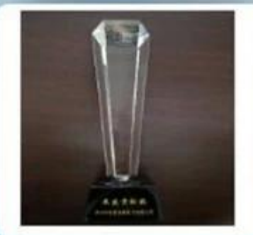
Outstanding and Honorable EBusinessman Award by Alibaba in 2010