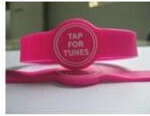
3. Silicone Wristbands (Adjustable Type)