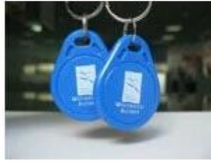
6. NFC Keyfobs