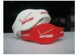
4. Silicone Wristbands (Full Sealed Type)