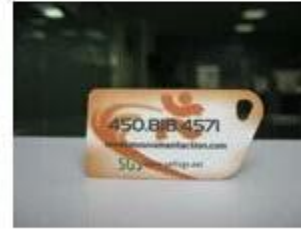
7. NFC PVC Tags