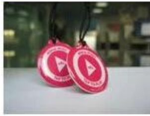
2. NFC Epoxy Tags