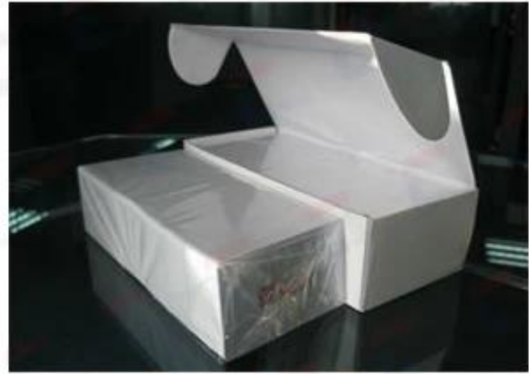
250/200 pcs Cards with Clear Paper