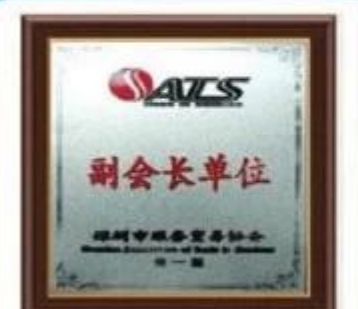
Vice President Company of Shenzhen Association of Trading in Services