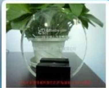
Outstanding and Honorable E-Businessman Award by Alibaba in 2011

Tarjeta inteligente co., Ltd de Shenzhen Chuangxinjia ofrece pulseras RFID en una variedad de materiales, como silicona, tejido (tela) y el plástico, el papel de etcetera. Podemos personalizar para incluir su logotipo y tenemos una variada gama de ofertas de color. Tenemos pulseras de RFID para punto de venta, habitaciones sin llave, control de acceso y seguridad, prevención de falso, programas de lealtad de clientes y ambientes impermeables. Nuestro objetivo es ayudar a pulsera de diseño bien sellado que fiabilidad puede almacenar y transferir datos.