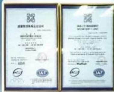
ISO9001:2000 Quality Management System