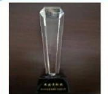
Outstanding and Honorable EBusinessman Award by Alibaba in 2010