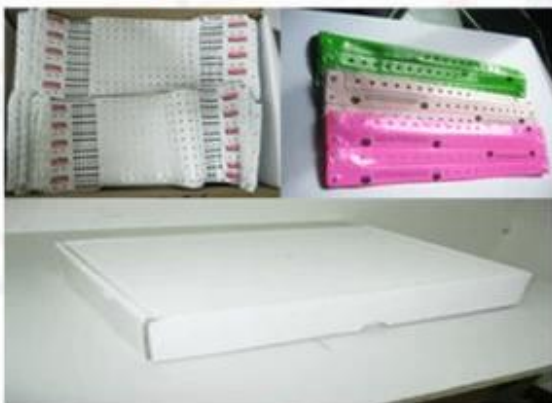
Package for Soft PVC/ Paper Wristbands