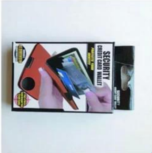
Custom printed box