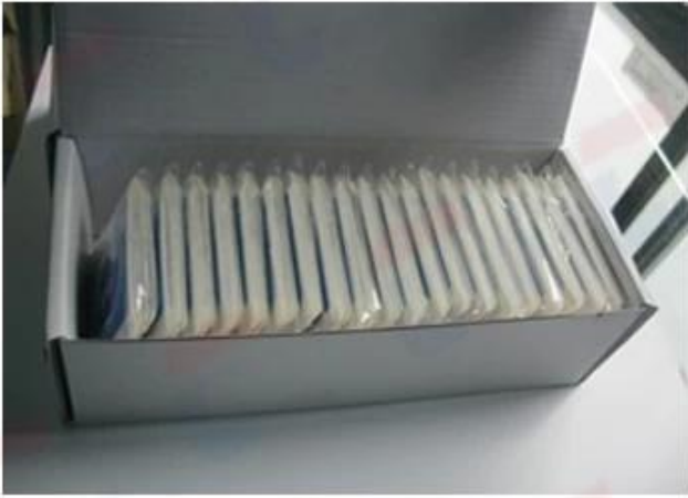
Packed By Pieces with OPP Bags