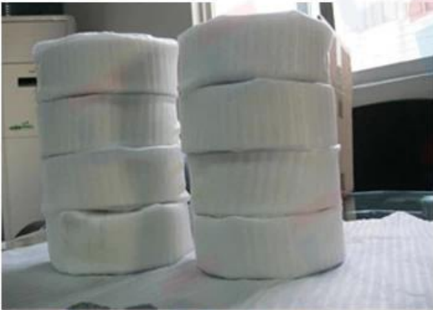
Protect with Bubble Pack