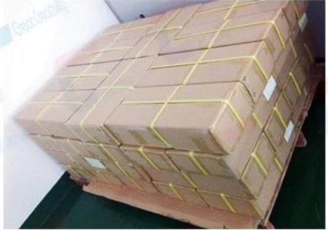
Outside Carton Package