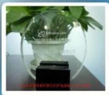
Outstanding and Honorable E-Businessman Award by Alibaba in 2011

Shenzhen Chuangxinjia Smart Card co., Ltd RFID-Armbänder in einer Vielzahl von Materialien wie Silikon, gewebt (Tuch), und Kunststoff, Papier usw. bietet. Wir können, um Ihr Logo und wir haben eine verschiedene Reihe von Farbe angeboten. Wir verfügen über RFID-Armbänder für Point of Sale, schlüssellose Hotelzimmer, Zutrittskontrolle & Sicherheit, gefälschte Prävention, Kundenbindungsprogramme und wasserdichte Umgebungen. Unser Ziel ist es, Design sicher abgedichtet Armband zu helfen, die zuverlässig speichern und übertragen von Daten.