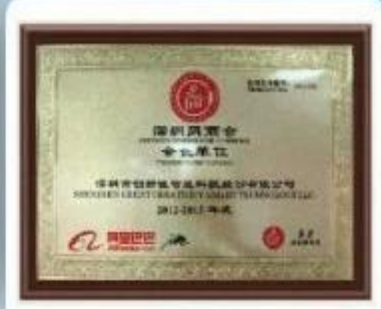
President Member Company of Shenzhen Chamber of E-Commerce