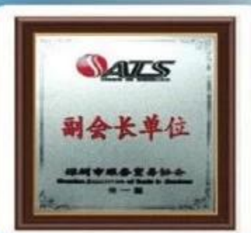
Vice President Company of Shenzhen Association of Trading in Services