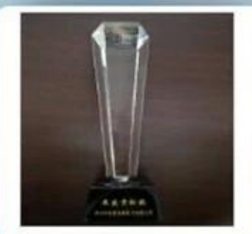
Outstanding and Honorable EBusinessman Award by Alibaba in 2010